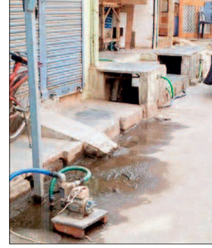
हाईवेयर लाइन सुपेला में कई घरों के बाहर लगे सबमर्सिबल पंप।