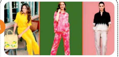
बाहर जाना है तो न्यू लुक...