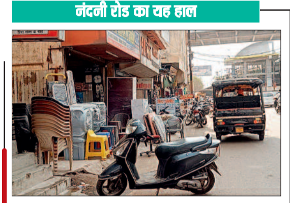
नंदिनी रोड के दोनों किनारे पर दुकानों का सामान रखा जाने लगा है। जिसकी वजह से मुख्य सड़क की चौड़ाई कम हो गई है। सामान लेने के लिए ग्राहक अपना वाहन खड़े करते हैं तो सड़क पर जाम की स्थिति फिर से बन गई है। ठेले और खोचने वाले फुटकर व्यवसाय करने के लिए सड़क किनारे का ही इस्तेमाल कर रहे हैं। ओवरब्रिज के नीचे नंदिनी रोड से लेकर एसीसी जामुल चौक तक यही दृश्य दिखाई देने लगा है। भारी वाहनों का यही से आना जाना होता है। पावरहाउस मार्केट भी आने जाने के लिए लोग इसी मार्ग का इस्तेमाल करते हैं जिसकी वजह से इस रोड पर ट्रैफिक की समस्या से लोग जूझ रहे हैं।