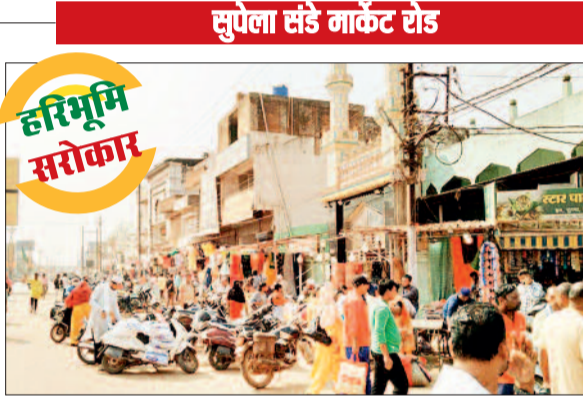
सुपेला संडे मार्केट की यह तस्वीर बर्बाद कर रही है कि कब्जे कर दुकान चलाने का तरीका बदल गया है। यहां सड़क किनारे की दुकानदारों ने कब्जा जमा रखा है और सड़क होकर कारोबार करने लगे हैं। सुपेला संडे मार्केट अब सड़क मार्ग से जुड़ी गलियों के पास ही लगाने लगा है। रहवासियों ने बताया कि मुख्य सड़क मार्ग तो खाली हो गया है पर अब गलियों में जाम की स्थिति निर्मित हो गई है। हाल यह है कि दुपहिया वाहन तक नहीं निकाल सकते। गली मार्ग के पीछे से आवागमन करना पड़ रहा है। दुकान लगाने से मना करने पर वाद-विवाद की स्थिति निर्मित हो रही है।

सुपेला संडे मार्केट का स्थाई समाधान निकले इसके लिए कोई कार्ययोजना नहीं बन पाई है। नतीजा यह हो रहा है कि सुबह-सुबह मिलाई निगम व पुलिस बल संयुक्त रूप से पहुंचती हैं और एक घंटे के बाद वे टीम चली जाती है। उसके बाद दुकानदार अपना कारोबार इसी जगह पर करना शुरू कर देते हैं। राहत यही है कि मुख्य रोड के बीचों-बीच फुटकर का कारोबार पर अंकुश लगा है। रहवासियों का कहना है कि फुटकर व्यवसायों के लिए कोई ऐसी योजना बनाई जाए कि वे यहां ट्रैफिक व्यवस्था को ध्वस्त न कर सकें। एक दुकानदार को देखकर धीरे-धीरे दूसरा और फिर तीसरा दुकान लगती है। निगम व प्रशासन भी अपने दौंगर कार्यों में इतना व्यस्त हो जाती है कि आम जनता से जुड़ी इस महत्वपूर्ण मसले को हाशिए में डाल देती है। जिसका फायदा दुकानदार उठाते लगे हैं।