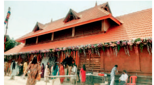
सेक्टर-04 एसएनजी मंदिर में हर साल की तरह इस साल भी महाशिवरात्रि पर विशेष अनुष्ठान किए गए। जिसके लिए मंदिर को दक्षिण भारतीय शैली में सजाया गया था।